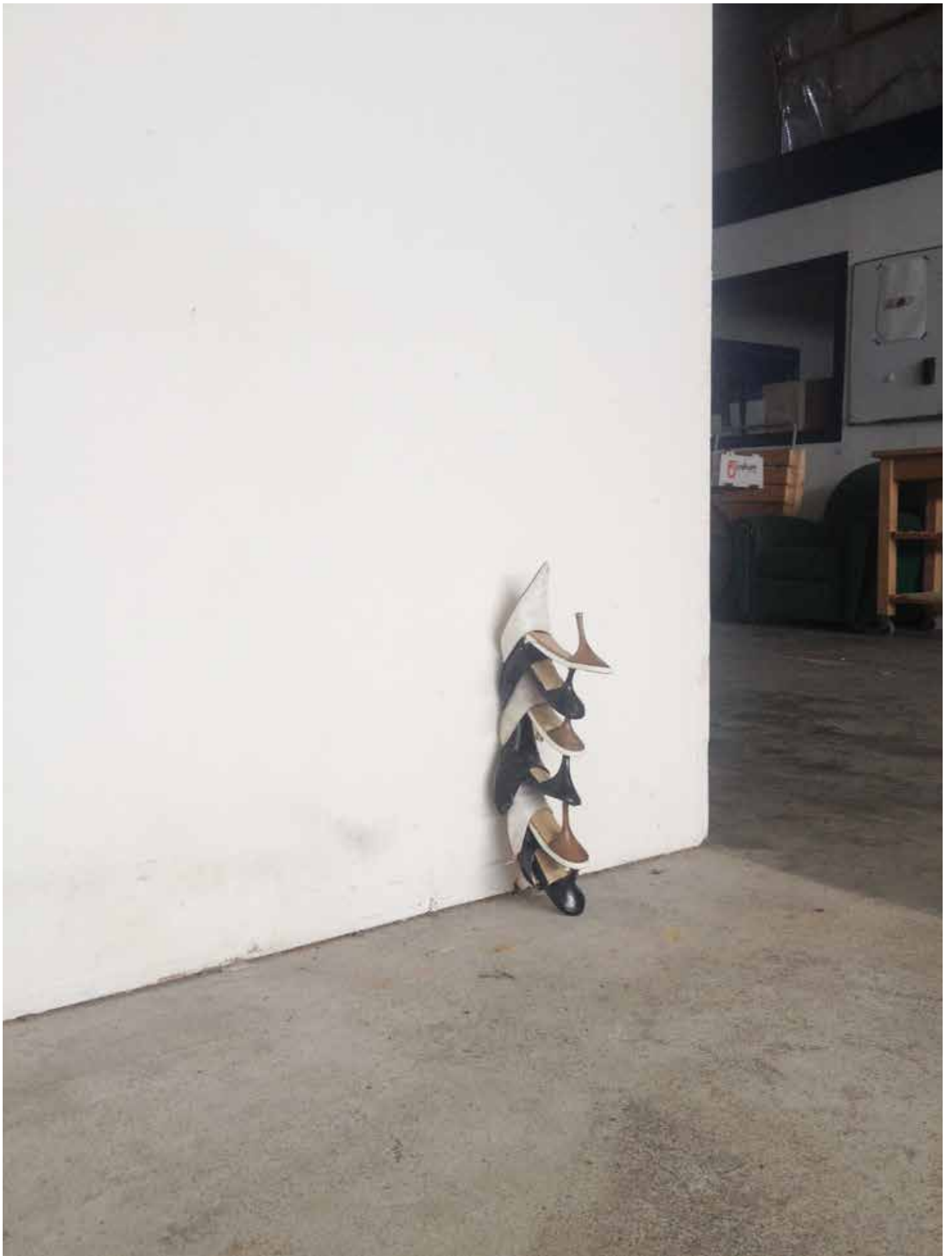
pointes et talons, 2020 chaussures modifiées, 48 x 19 x 8 cm