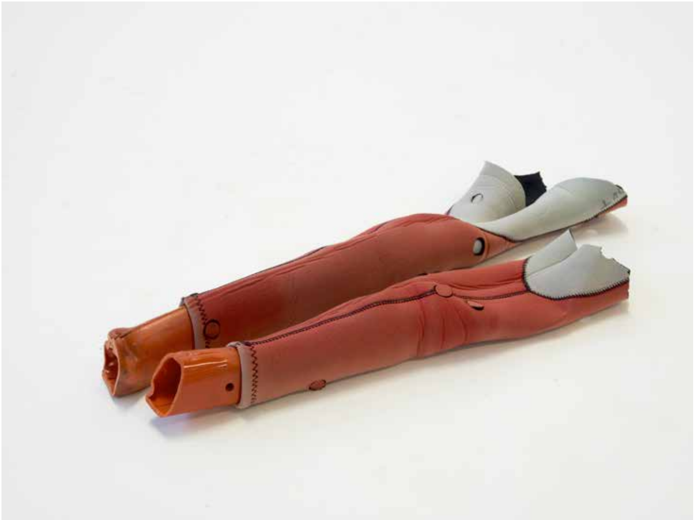
non intitulé 2020 manches de combinaison de plongée introduites de manche de coupe bordure en plastique 7 x 55 x 23 cm