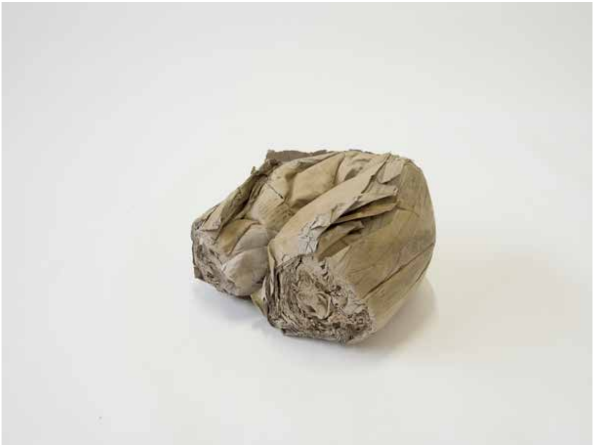
non intitulé 2020 carton modelé 24 x 35 x 38 cm