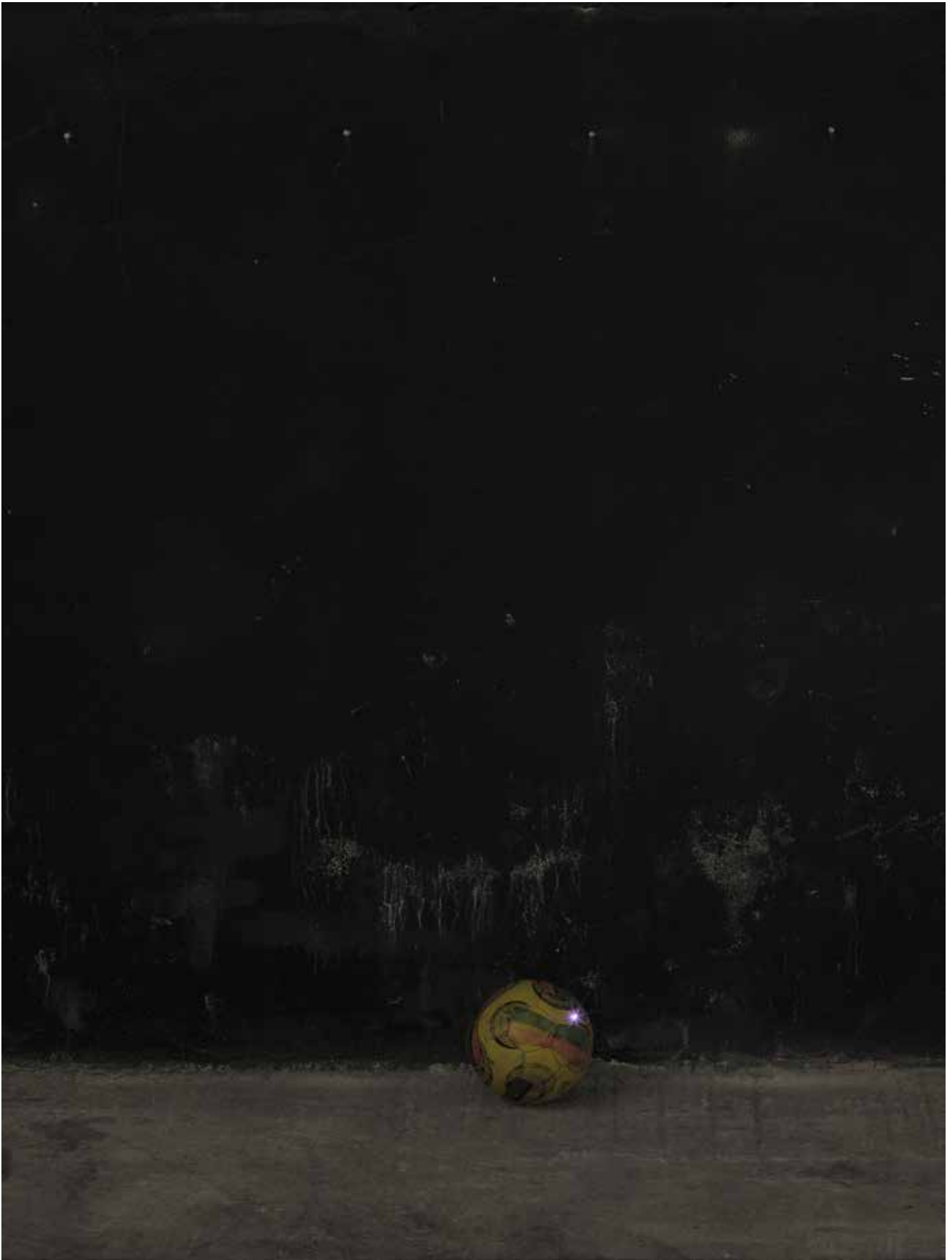
vue d'exposition, Derrière la porte espace —, Marseille, 2020 ballon de football, led violette 48 x 19 x 8 cm