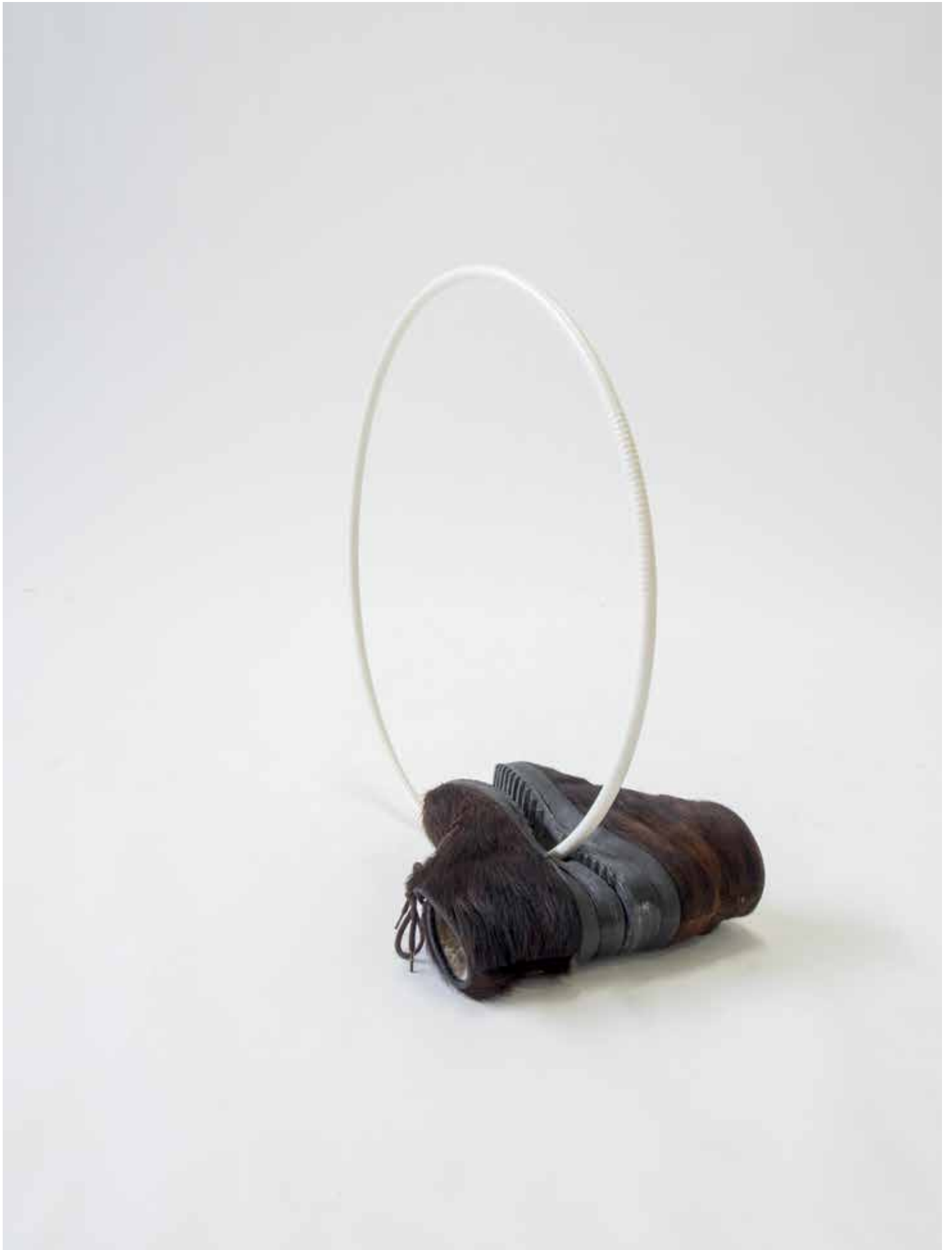
heroes and vilains 2020 paire de chaussures de tailles différentes, cerceau en plastique ø 57 x 30 x 60 cm