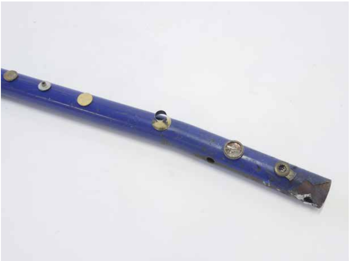
droite et segments 2021 tube de métal arrangé d'objets diversement circulaires ø 4 cm x 100 cm