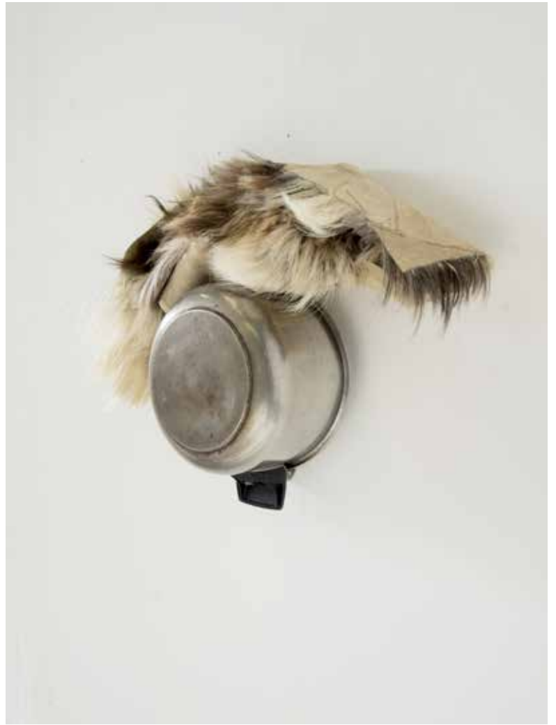
non intitulé, 2021 cocotte minute, fourrure animale