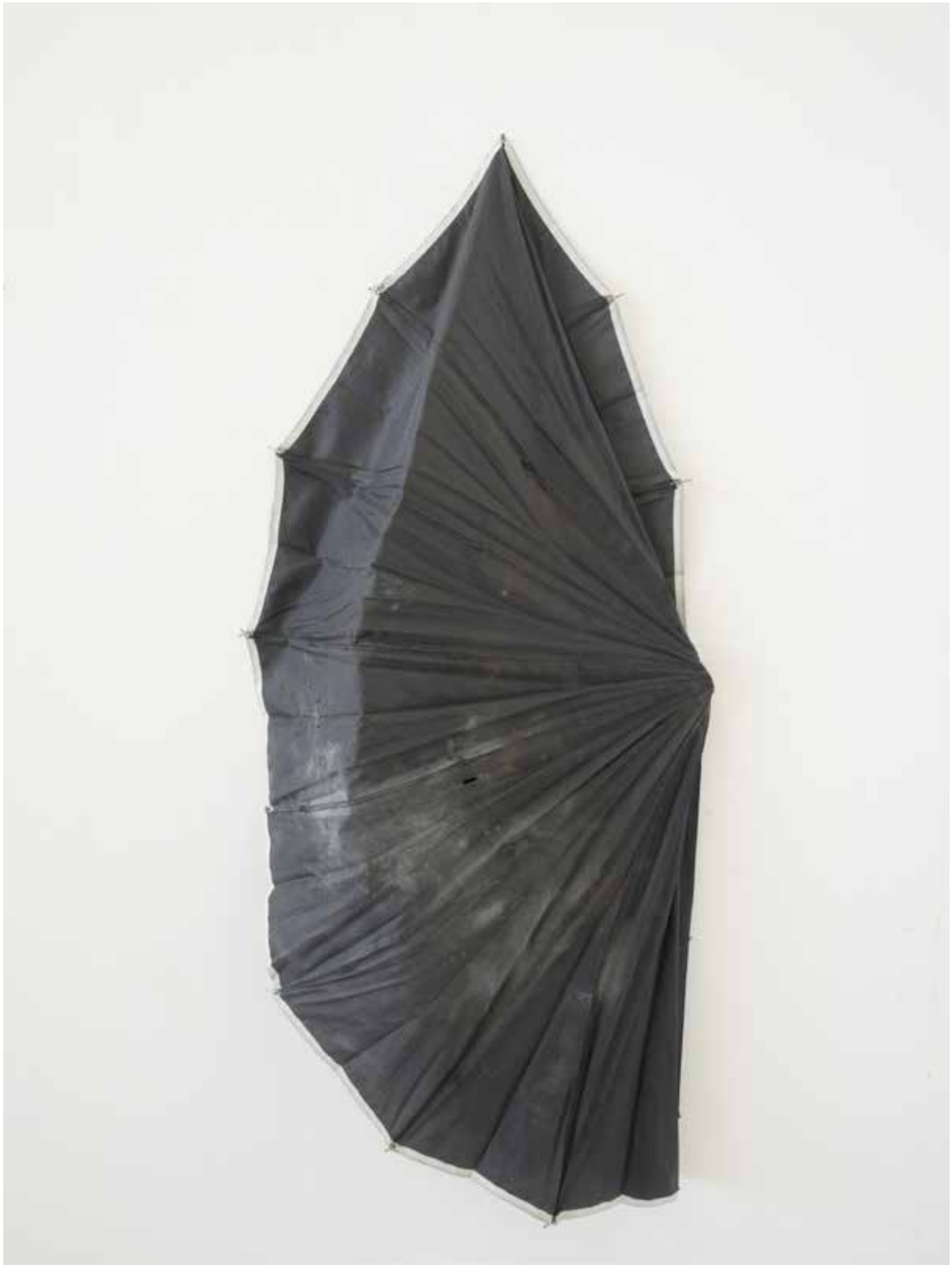
non intitulé, 2021 toile de parapluie altérée