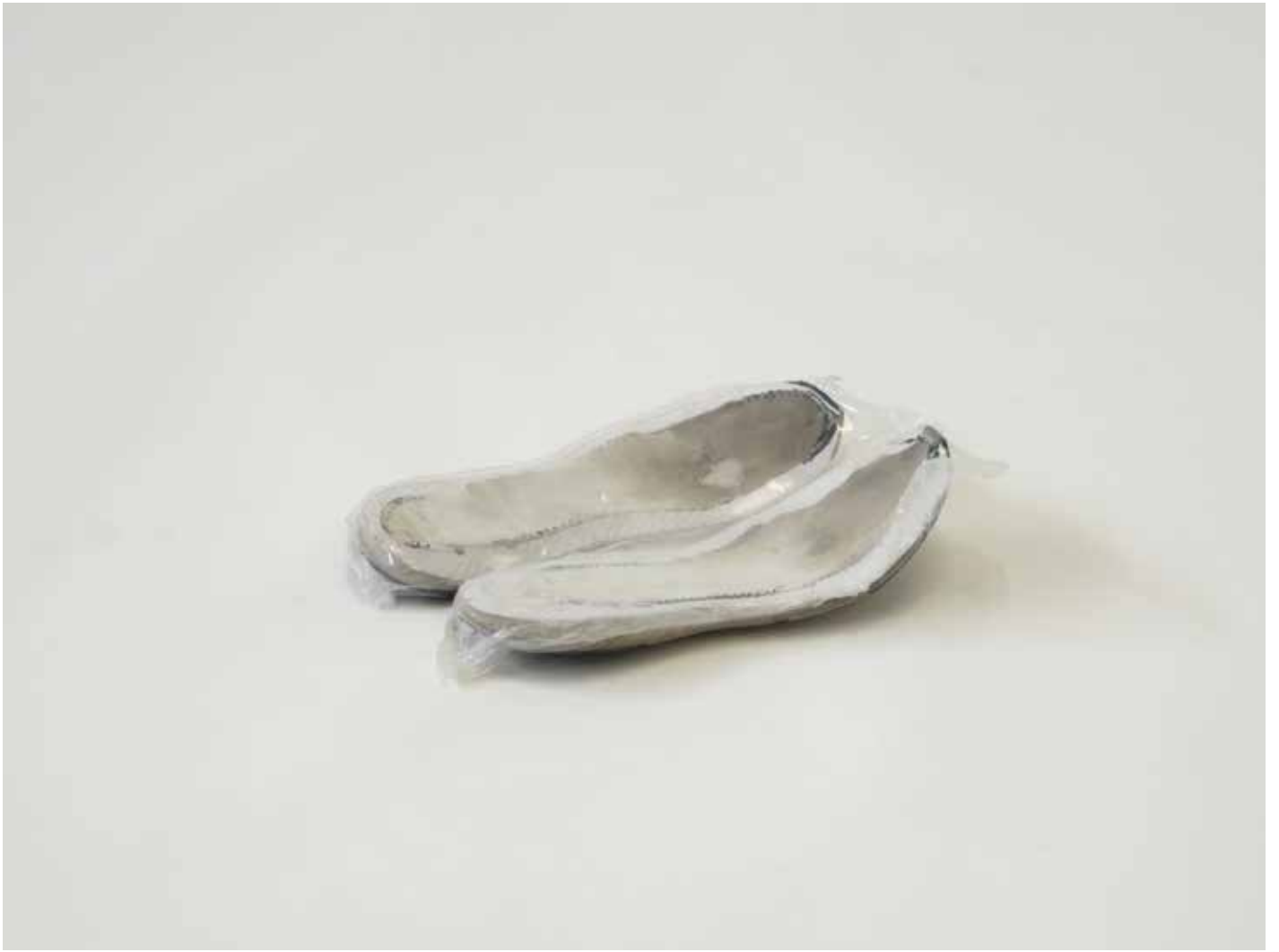
non intitulé, 2021 semelles de chaussures usagées, sous blister