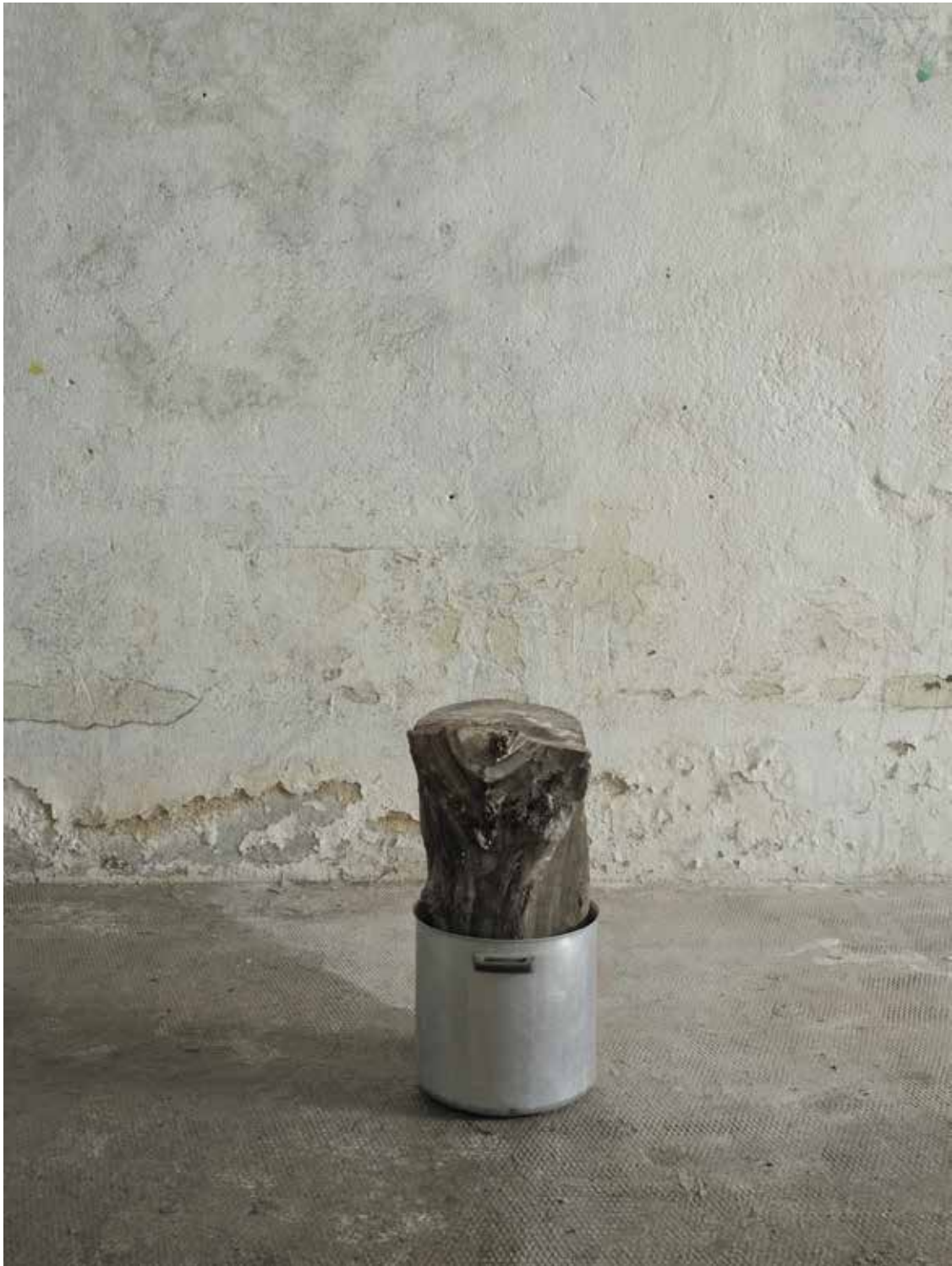
vue d'exposition, l'instant, le seuil, le segment, l'unité Night_time_story, L.A, 2021 tronc d'arbre rejeté par le fleuve, fait tout en aluminium (version courte) ø25 x 54 cm