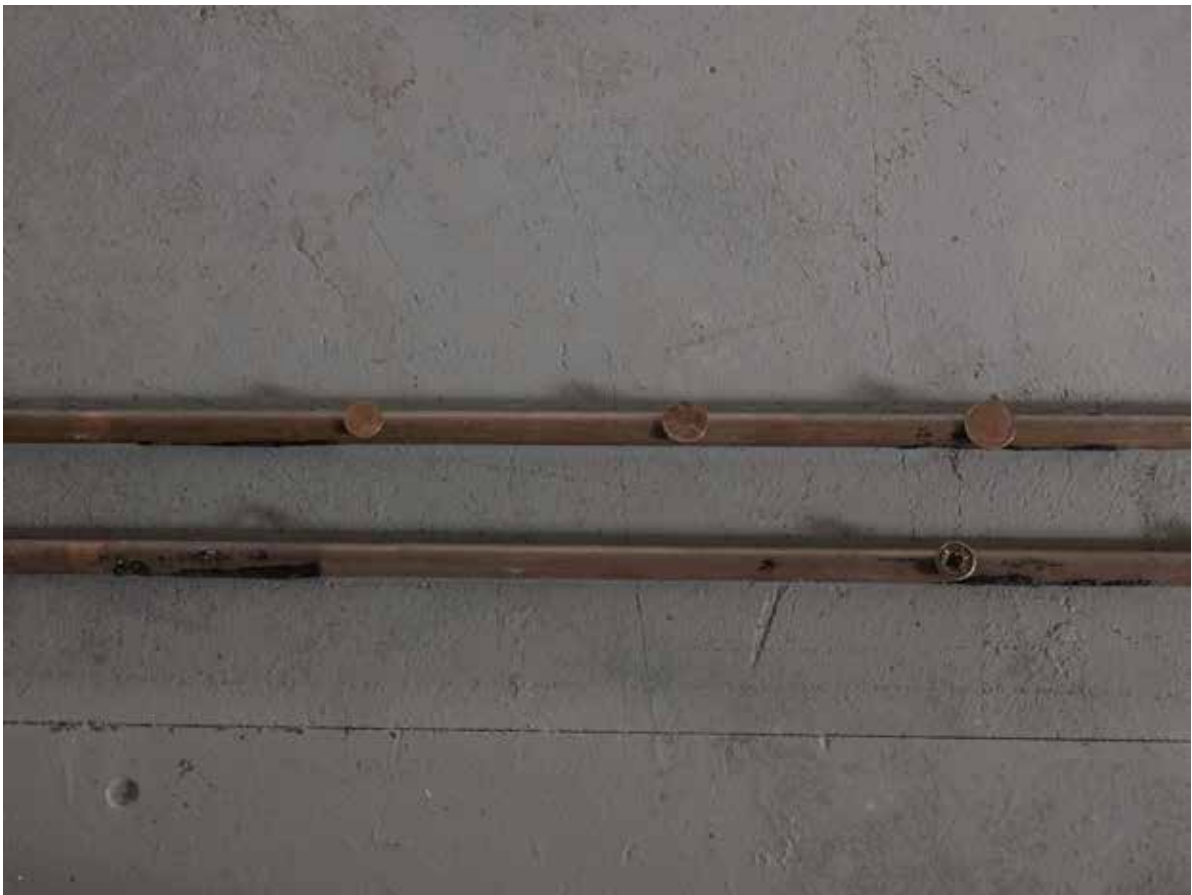
vue d'exposition, l'instant, le seuil, le segment, l'unité Night_time_story, L.A, 2021 2 tubes de cuivre, pièces de monnaie