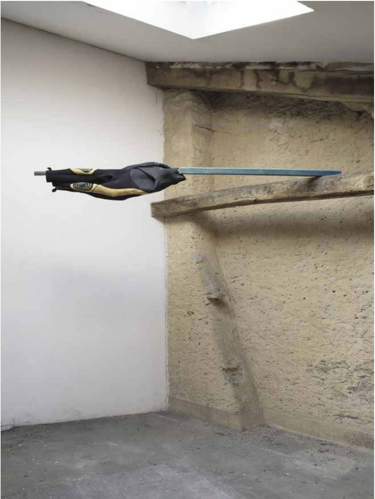
vue d'exposition, l'instant, le seuil, le segment, l'unité Night_time_story, L.A, 2021 combinaison de plongée, tube en métal