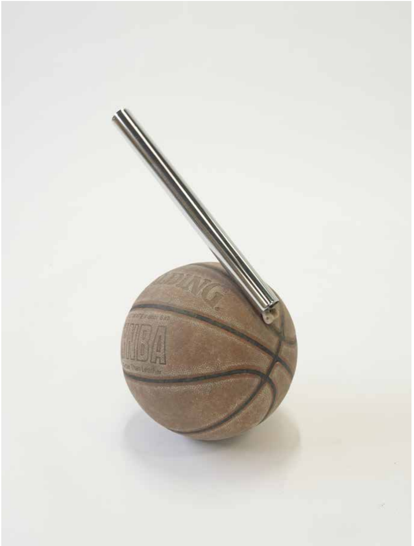
non intitulé 2021 ballon de basket, os de poulet, tube d'aspirateur ø 24 cm