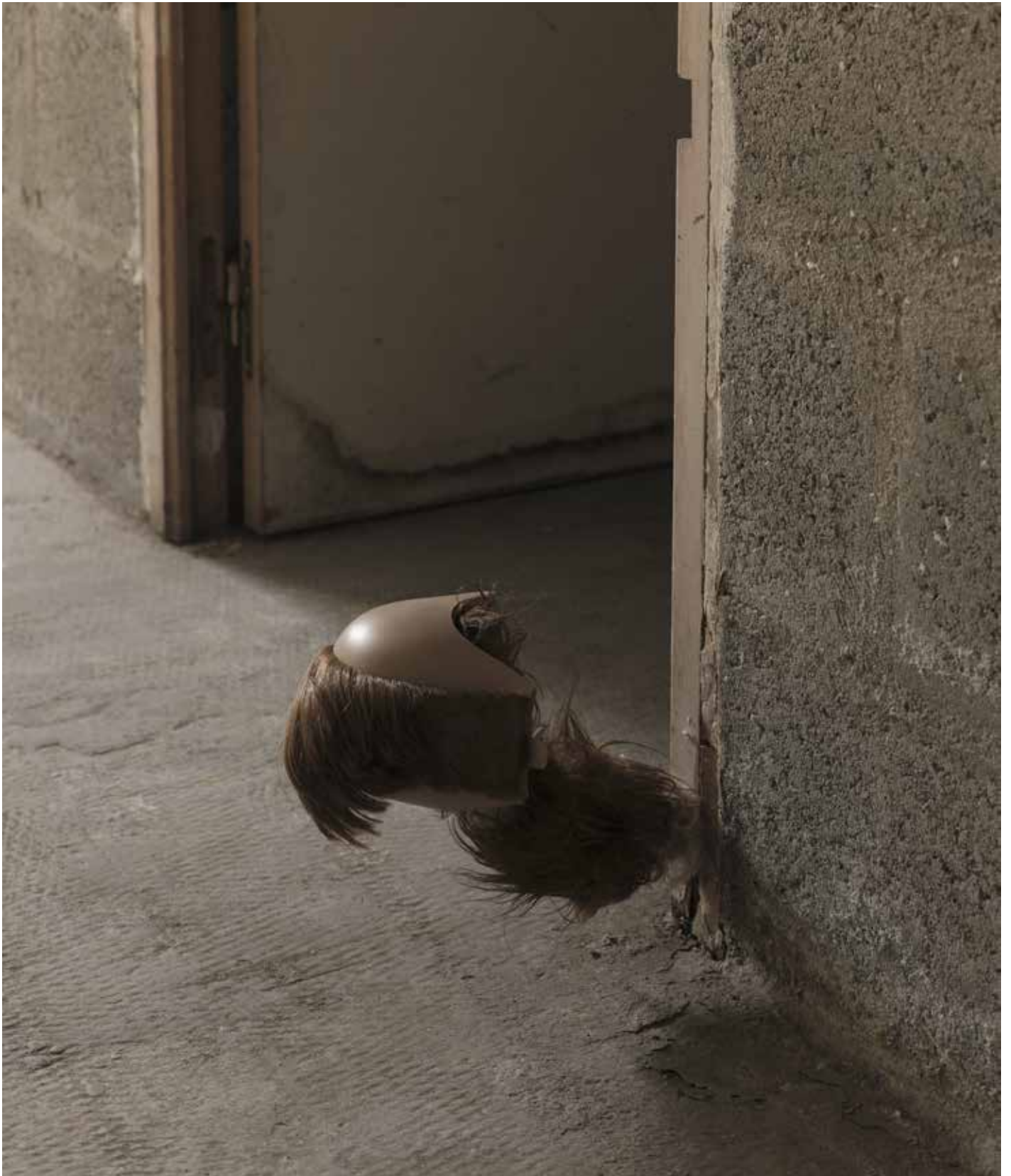
non intitulé 2021 cheveux véritables, tube en métal et peluche synthétique 30 x 22 x 24 cm