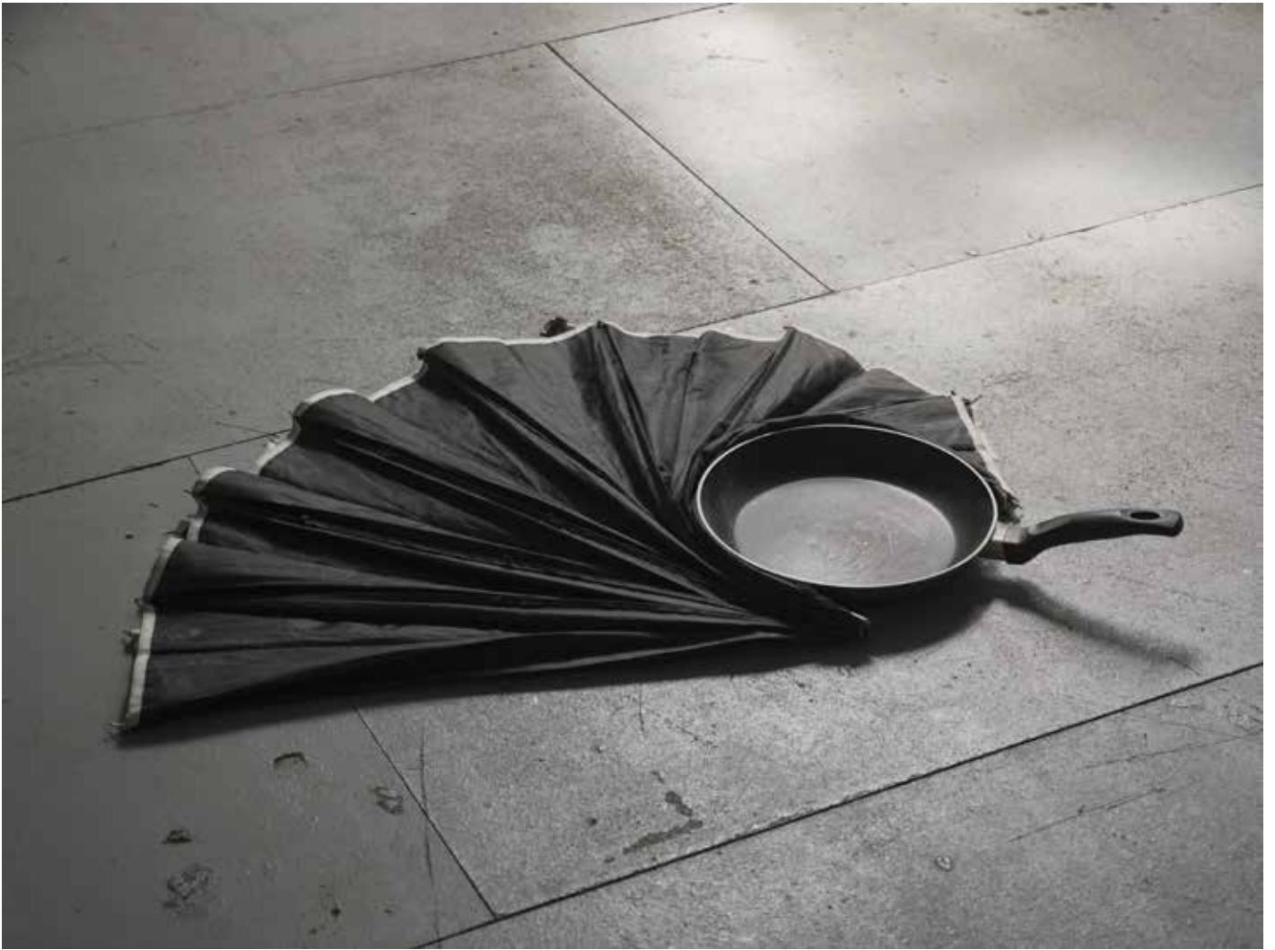
non intitulé 2021 poêle à frire, toile de parapluie 8 x 85 x 70 cm