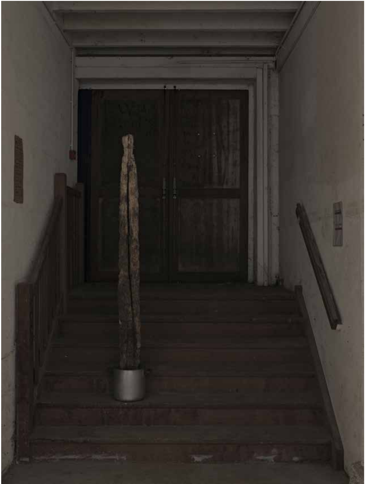
vue d'exposition, l'instant, le seuil, le segment, l'unité Night_time_story, L.A, 2021 tronc d'arbre rejeté par le fleuve, fait tout en aluminium ø25 x 204 cm