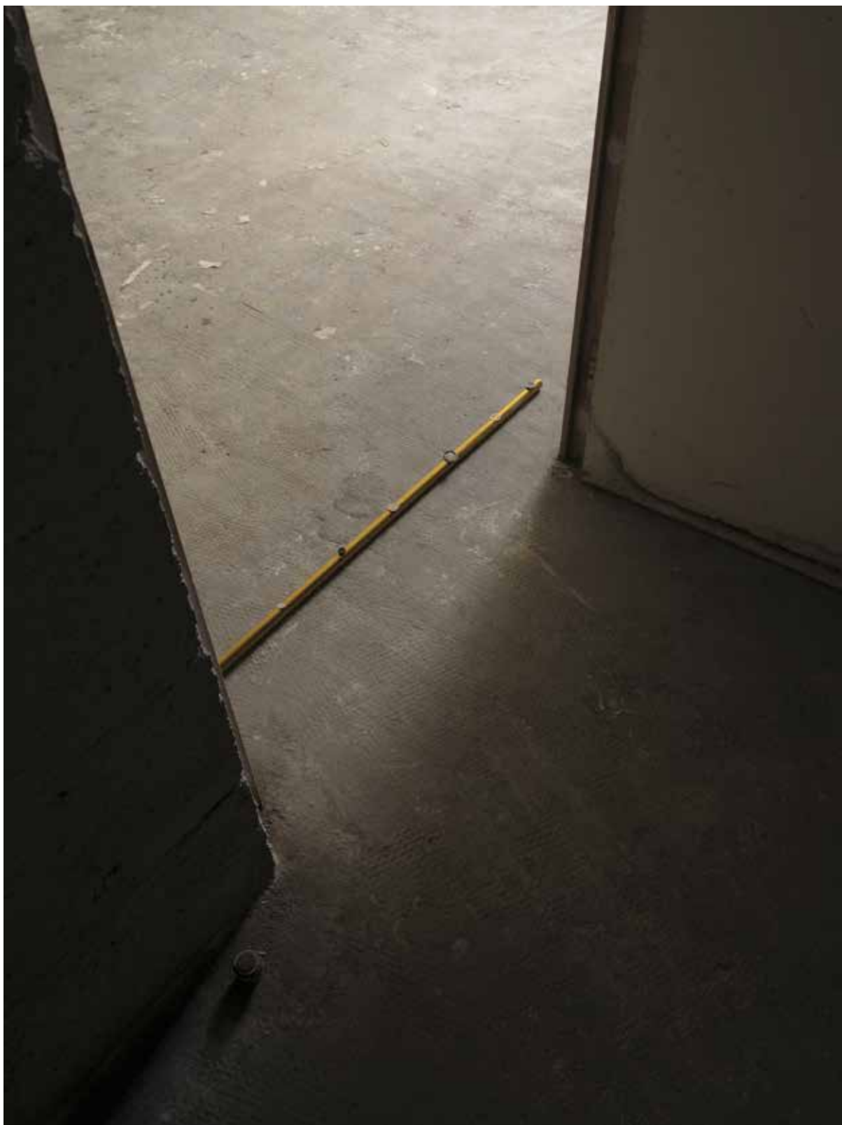
vue d'exposition, l'instant, le seuil, le segment, l'unité Night_time_story, L.A, 2021 tube en métal doré arrangé d'objets diversement circulaires ø2 x 104 cm