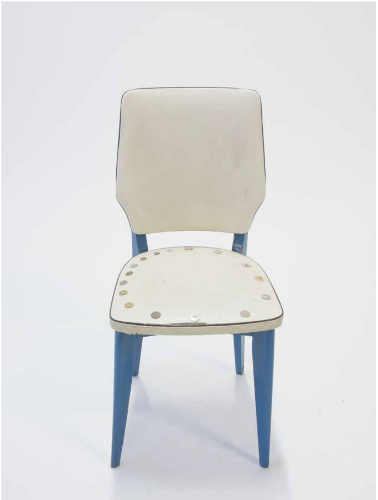
non intitulé 2021 chaise bornée de pièces, rondelles et jetons 86 x 41 x 38 cm