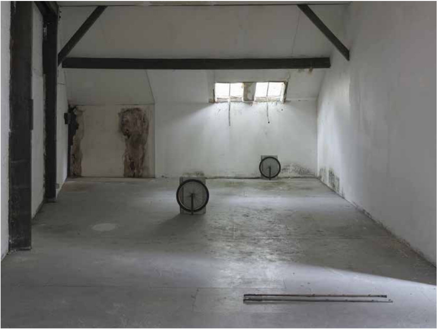
vue d'exposition, l'instant, le seuil, le segment, l'unité Night_time_story, L.A, 2021 roue de bicyclette d'appartement montée sur un tube et une tôle en acier, rotation libre