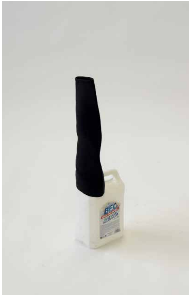
non intitulé 2021 bidon d'eau de javel coiffé d'une manche de combinaison de plongée 68 x 13 x 18 cm