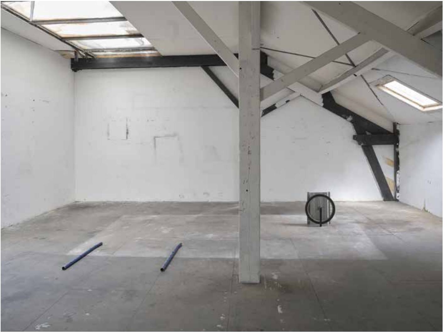
vue d'exposition, l'instant, le seuil, le segment, l'unité Night_time_story, L.A, 2021 tube de métal arrangé d'objets diversement circulaires ø 4 cm x 100 cm